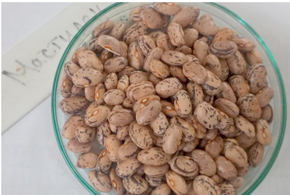
Şekil 6.1. Mastilen çeşidi