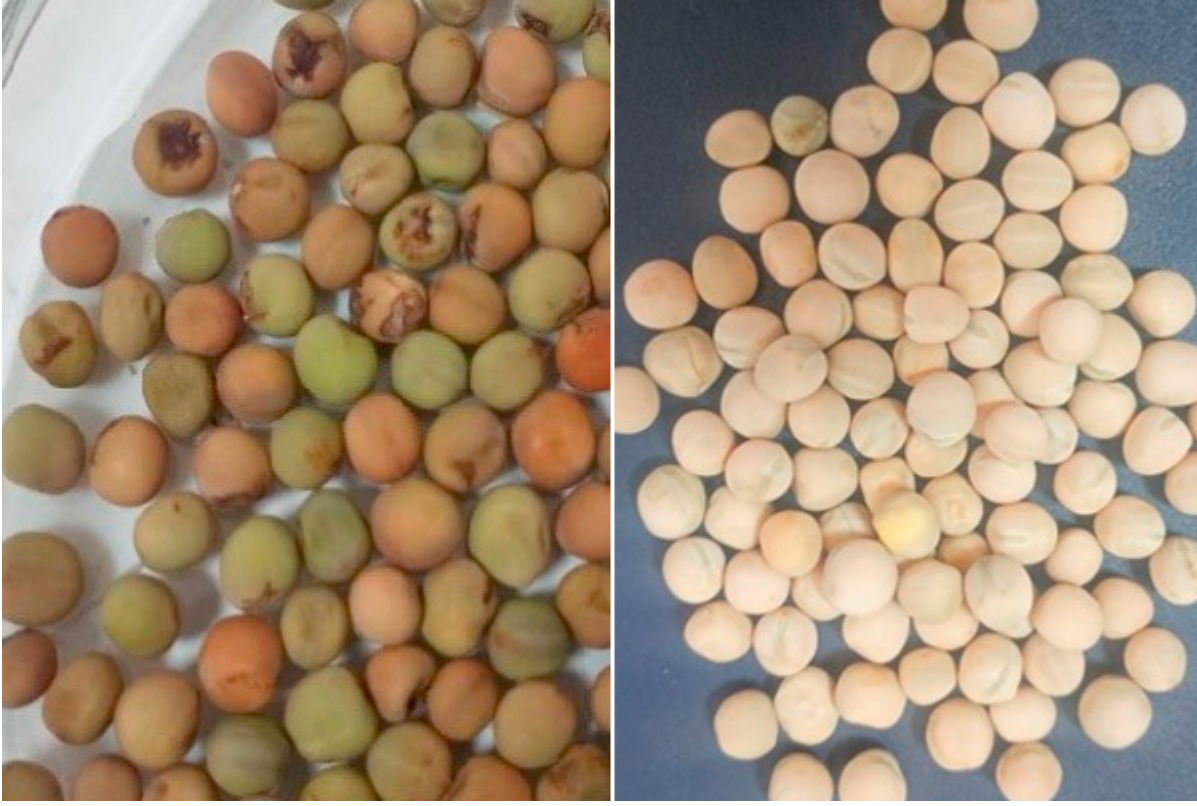
Şekil 5. Bahçe bezelyesi aksesyonlarında tohum rengi, yüzeyi ve şekli