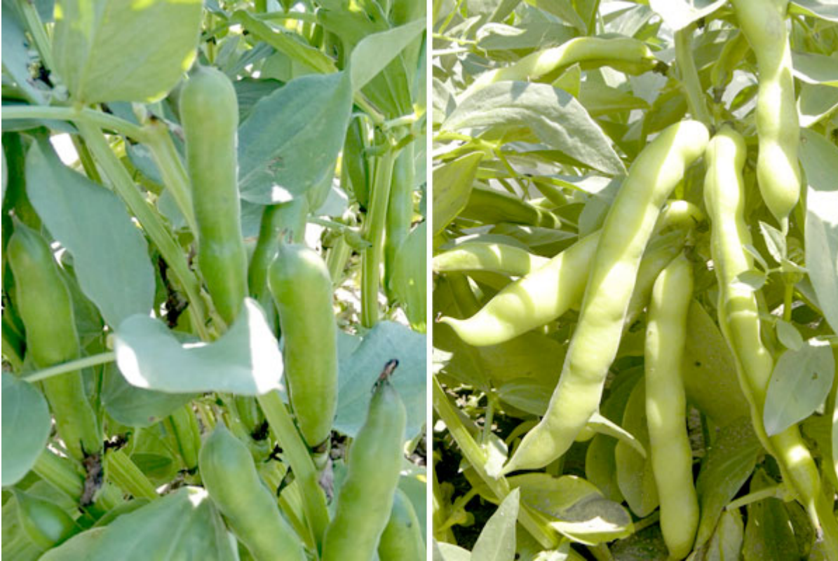
Şekil 7. Bakla Angelova ve Dink

Bitkiler dik bir gövdeye sahiptir ve 120 cm yüksekliğe ulaşır (Şekil 7). Çiçekler beyaz olup kanatlarda karakteristik koyu bir leke bulunur. Meyve bir bakladır ve teknolojik olgunlukta yumuşak ve hassastır. Bundan sonra hızla sertleşir ve tüketim kalitesini kaybeder. Tohumlar, diğer sebze bitkilerine kıyasla en büyük olanlardır. Doğrusal boyutlar, mutlak ağırlık, şekil ve renk farklı genotipler arasında değişir.