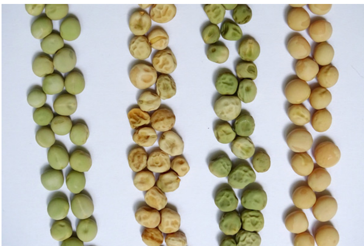
Fig. 5.1. Cor, superfície e forma das sementes em acessos de ervilha