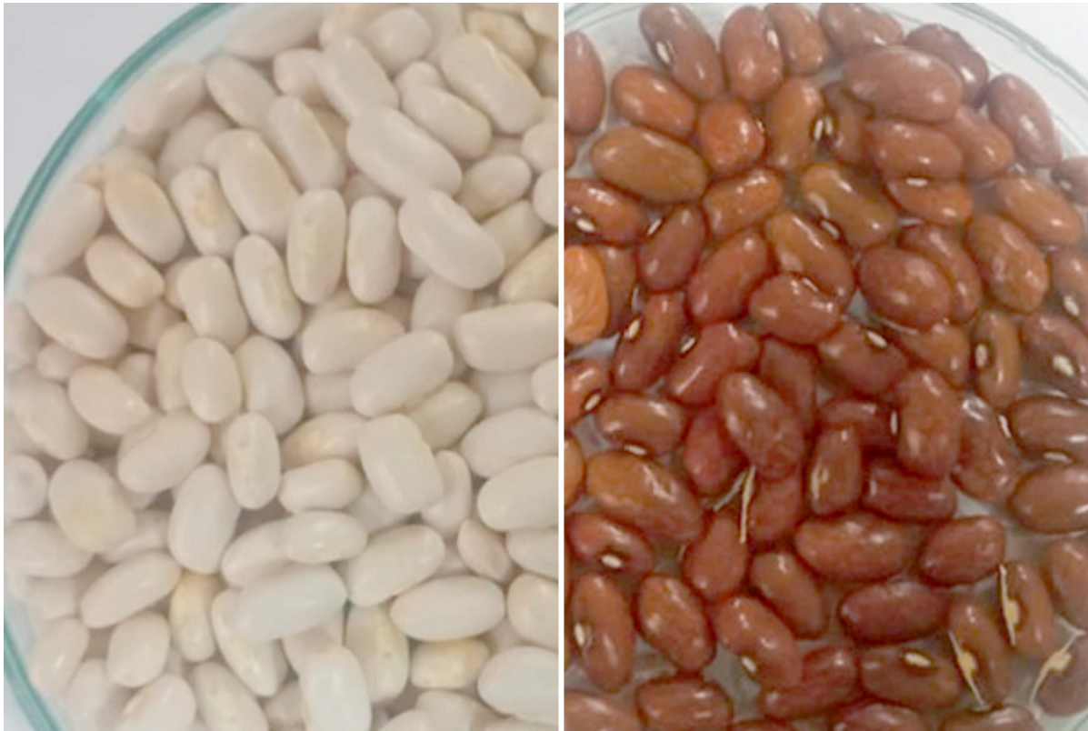
Fig. 6. Cor da semente nas linhagens: 208, 1105/19/4 - segregação

As vagens são amarelas ou verdes, planas ou planas-redondas, verdes com manchas em Mastilen. A cor e a forma das sementes variam de branco, creme, castanho e preto com salpicos em Lyastovichi, Tangra e Mastilen (Fig. 6). Ocorre segregação para a característica de cor da semente nas linhagens: 1105/19/4, 1105/19/6-1, 1105/24/7-3, 1105/24/10-1k (Tabela 1).