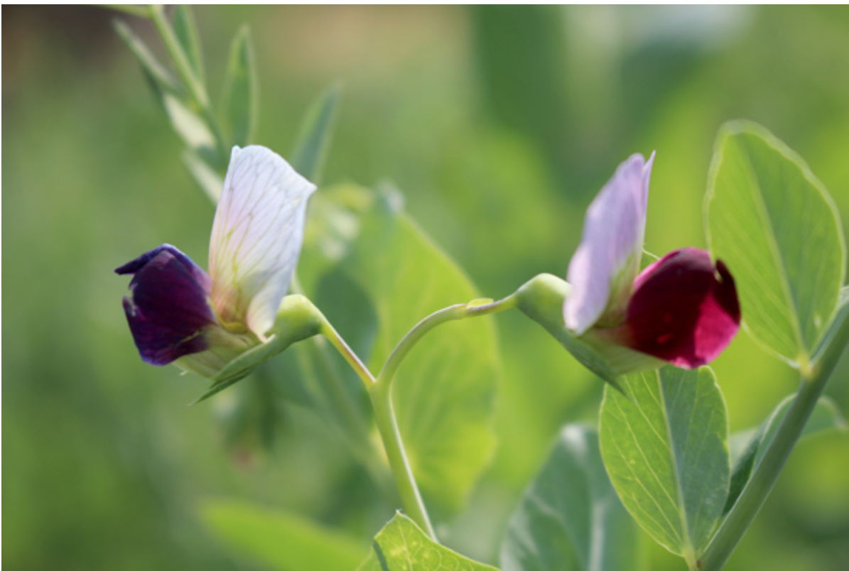
Fig. 2.1. Cor - rosa