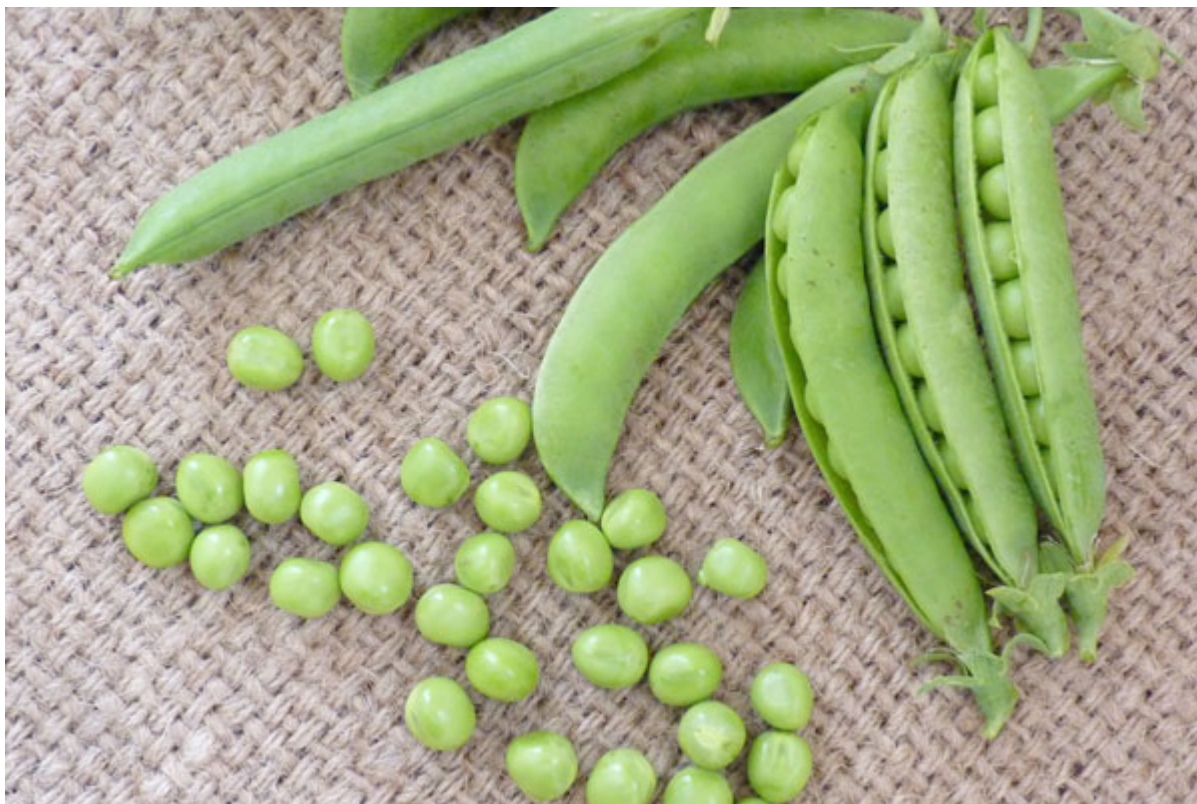
Fig. 3.1. Tipo de ponta da vagem - romba

Em condições de estufa, foram observadas vagens com neoplasmas - um crescimento de tecido caloso a partir dos estomas das vagens em maturação - na variedade Sovin (Fig. 4). Estas formações devem-se à falta de luz ultravioleta em condições de estufa (Teshome et al., 2016; Sari et al., 2020).