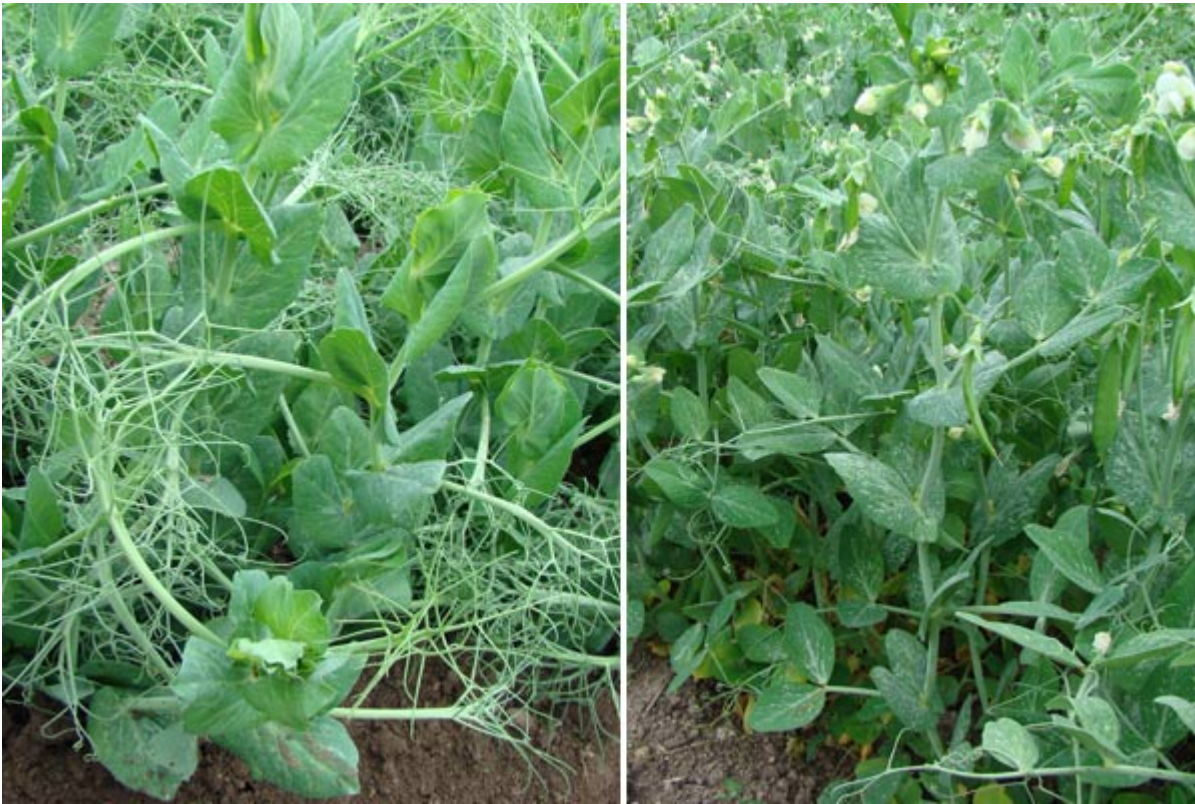
Fig. 2. Tipo de folha - afila e normal