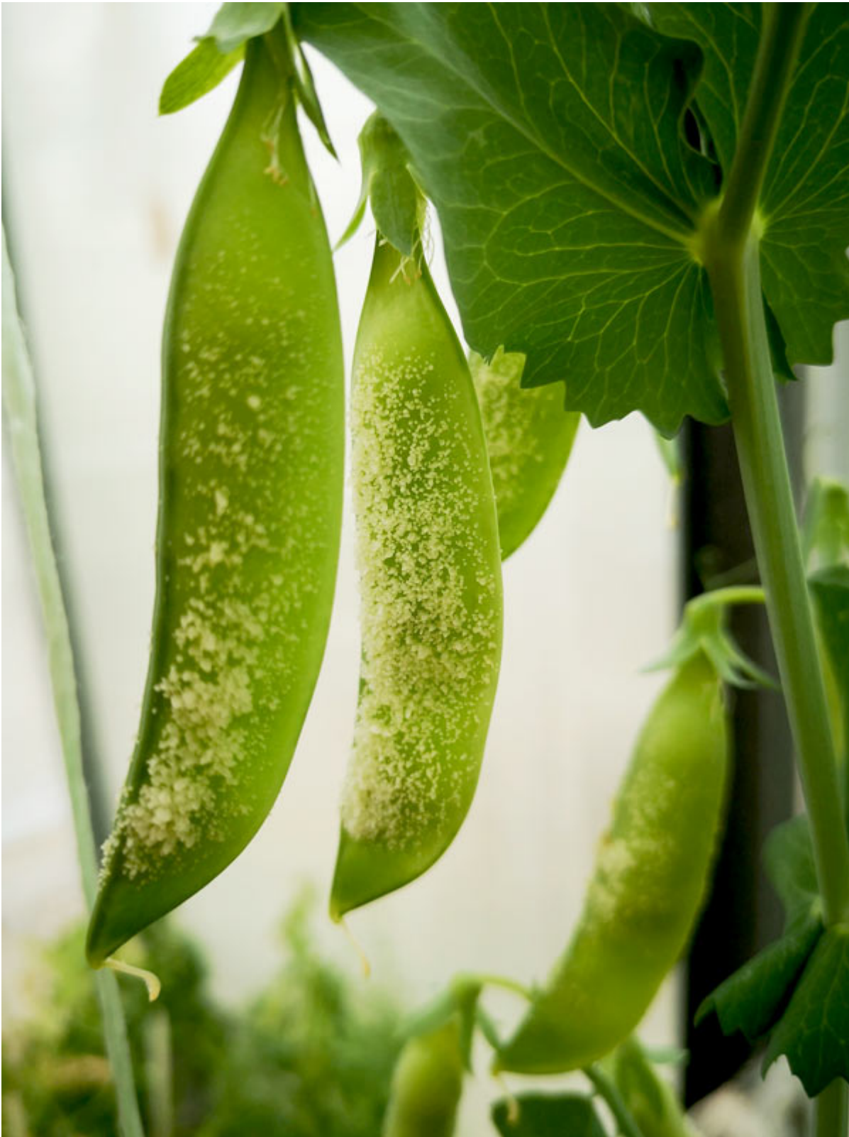
Fig. 4. Variedade de ervilha "Sovin" - vagem com neoplasma

A cor, a superfície e a forma das sementes variam de enrugada a lisa, creme, cinza-esverdeado a verde, redonda, esférica, em forma de tambor a tambor-angular (Fig. 5).