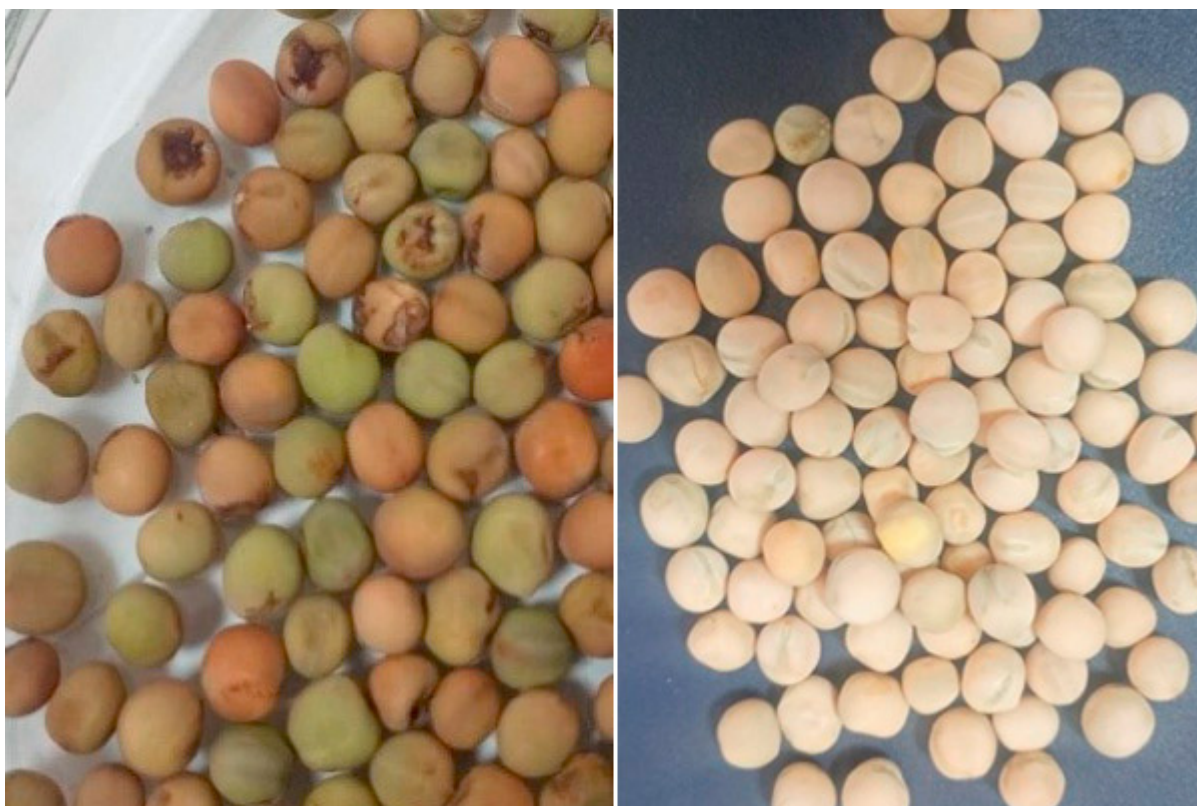
Fig. 5. Cor, superfície e forma das sementes em acessos de ervilha