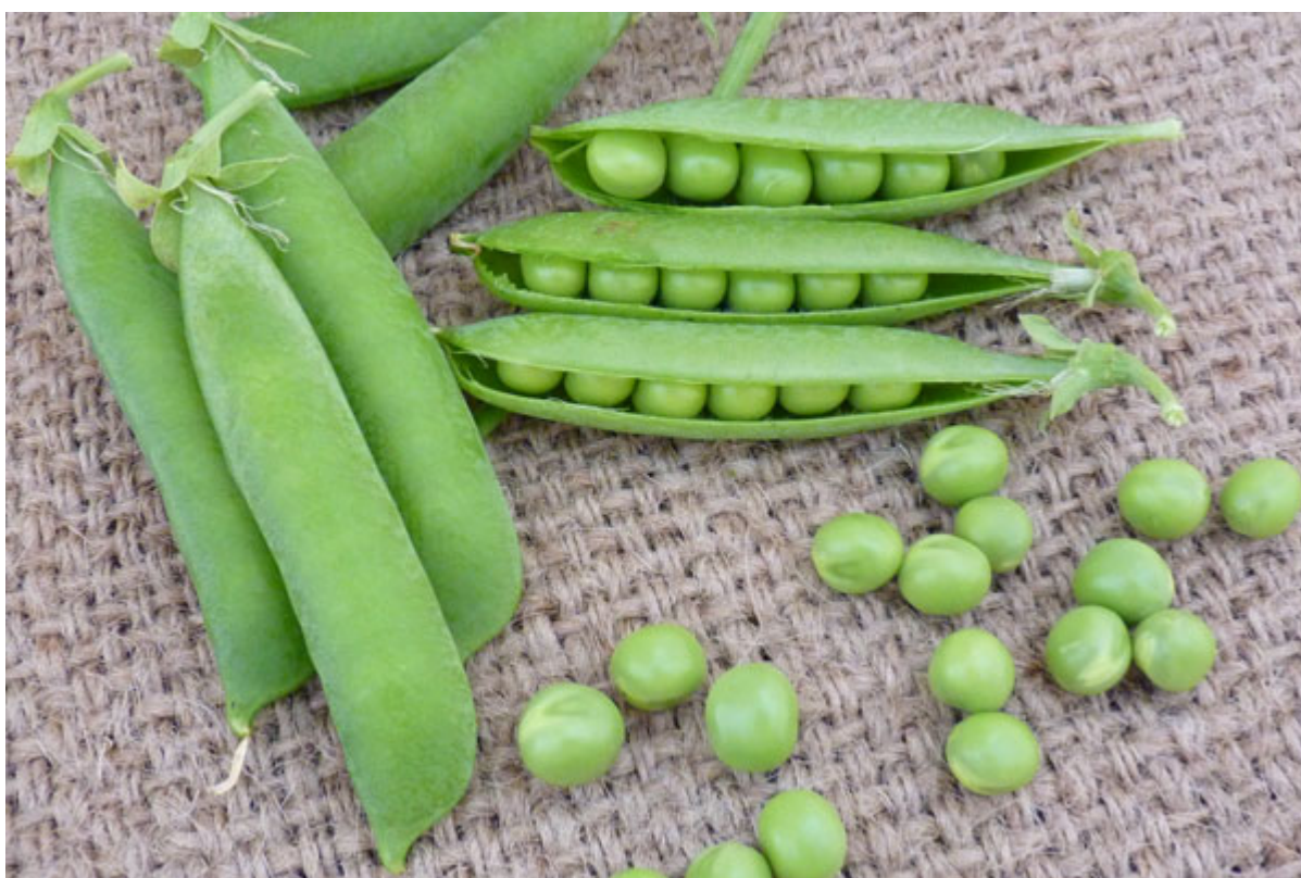
Fig. 3. Tipo de ponta da vagem – pontiaguda

As vagens são verdes, exceto uma de floração rosa com bordos de vagem violeta e sementes grandes e castanhas. Os frutos estão dispostos 1, 2 ou 3 por pedúnculo, retos, ligeiramente curvos ou em forma de sabre, com comprimento variável e diferentes números de sementes no seu interior (Fig. 3).