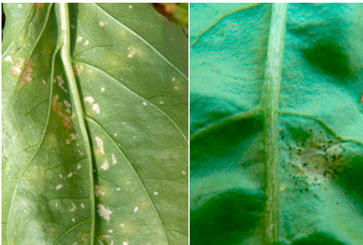
Повреди от трипс по листата на пипер

Двата вида трипсове са трудни за разграничаване. Оцветяването: възрастните F. occidentalis варира от жълто до тъмнокафяво. T. tabaci обикновено е по-блед, вариращ от бледожълт до светлокафяв. Калифорнийският трипс се отличава от тютюневия трипс по размерите на тялото ( T. t. 1,2 -1,4 мм, F. occ. 1,2-1,6 мм), по броя на четинките върху жилките на крилете ( T. t. - първата надлъжна жилка на крилото е без четинки в средата, а към върха е с 2-5 четинки, F. occ. - първата и втората надлъжни жилки на крилото са с четинки по цялата дължина), по броя и оцветяването на антенните членчета ( T. t. - антените са седемчленни, третото и четвъртото членче са с чифтна сенсила, F. occ. - антените са осемчленни, като третото и четвъртото членче са с чифтна сенсила), големината на средната двойка оцеларни четинки ( T. t. - главата е с две двойки очни четинки, F. occ. - главата е с три двойки очни четинки) и дължината на четинките върху преднегръда ( T. t. - в задния край на преднегръда има две двойки дълги четинки, а в предния край няма, F. occ. - в задния и предния край на преднегръда има още две двойки дълги четинки).