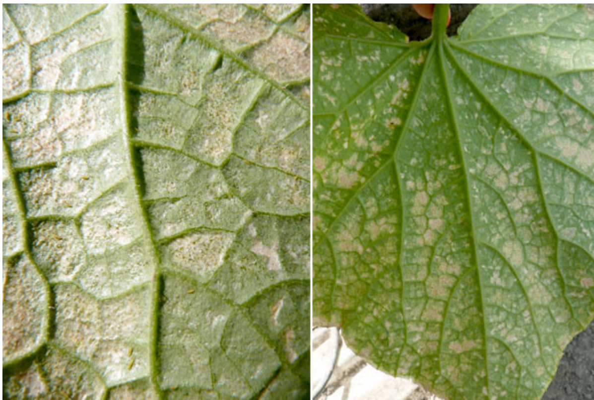
Повреди от трипс по листата на краставици

храненето на трипса побеляват, защото пространството отдолу е издълбано. Въпреки това епидермисът и стените остават непокътнати. Образува се „прозорец“, който пропуска светлина.